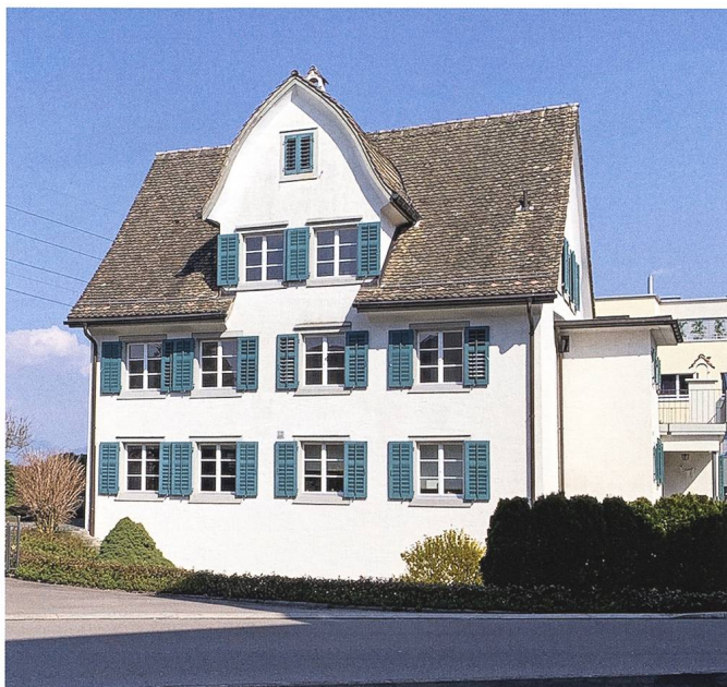
Abb. 5: Altendorf, Haus Hirschen, Brugglistrass 1: Hauptfassade, Ansicht von Westen.

zu einem Wohnraum ausgebaut werden, vorerst ohne spezifische Nutzung. Die Dachkonstruktion wurde wo nötig repariert, innenseitig gedämmt und mit grossformatigen Holzplatten verkleidet. Die Platten bilden die mehrfach geknickte Dachform nach und sind mit einem handwerklich kunstvollen Fugenbild ausgeführt worden. Die Eingriffe im Haus sind kaum sichtbar und sprechen für einen sorgfältigen Umgang mit der Bausubstanz. Durch den Umbau und die Restaurierung hat das Schutzobjekt an Bedeutung und Authentizität gewonnen.