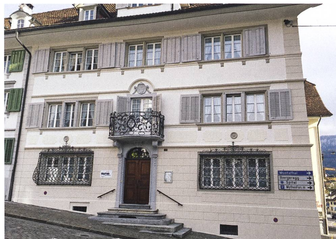
Abb. 2: Schwyz, Haus Hauptplatz 11: Hauptfassade, Ansicht von Westen.

Die Fassaden des herrschaftlichen Hauses am Hauptplatz 11 in Schwyz wurden vor rund 50 Jahren restauriert. Die Bauherrschaft wünschte sich eine erneute Auffrischung und Instandstellung. In einem ersten Schritt reinigte man die Unterdachansichten wie auch die verputzten Fassadenflächen. Danach wurden Risse und Salzausbildungen vorbehandelt und geflickt. Sämtliches Holzwerk wurde mit Laugenwasser gereinigt, angeschliffen und mit Ölfarbe neu gemalt. Die Farbenfassung orientierte sich am bestehenden Farbenkleid. Nebst den Fassadenflächen und dem