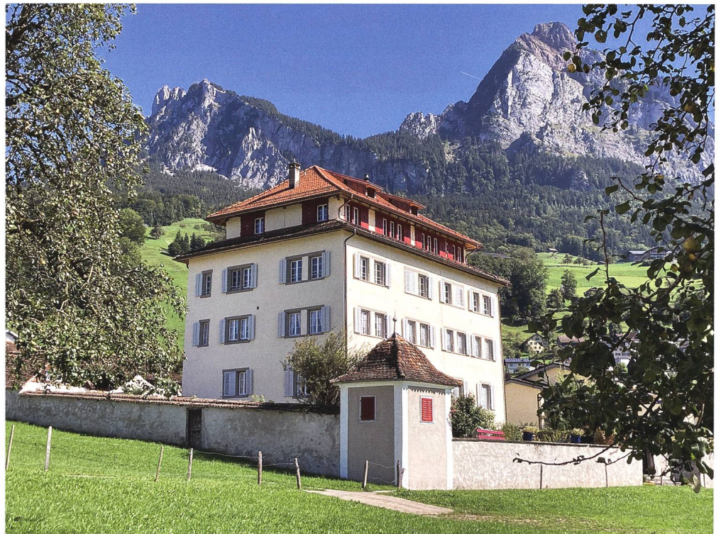
Abb. 1: Schwyz, Haus Ceberg im Feldli, Ansicht von Südwesten, mit Hauptfassade (besonnt).