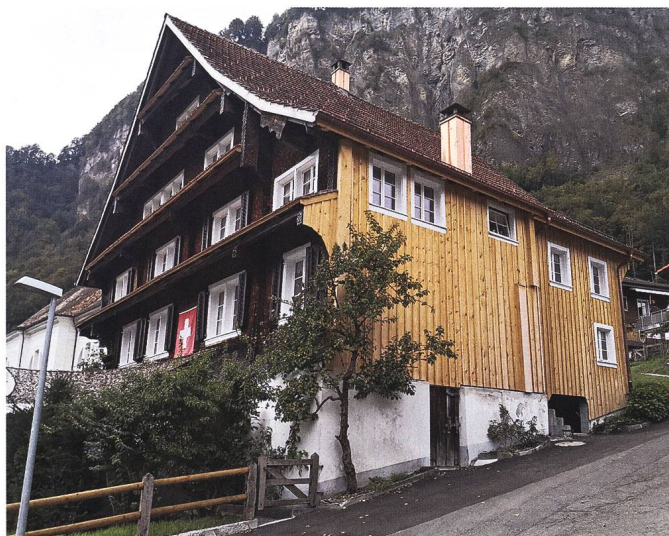
Abb. 4: Muotathal, Wohnhaus Wil 41: Seitenfassade mit Neuverschalung, Ansicht von Südosten.