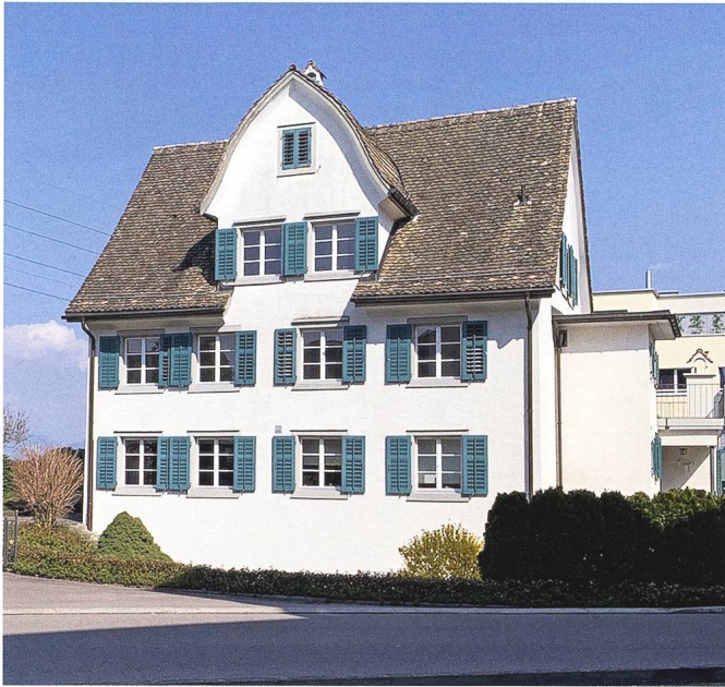
Abb. 5: Altendorf, Haus Hirschen, Brügglistrasse 1: Hauptfassade, Ansicht von Westen.

zu einem Wohnraum ausgebaut werden, vorerst ohne spezifische Nutzung. Die Dachkonstruktion wurde wo nötig repariert, innenseitig gedämmt und mit grossformatigen Holzplatten verkleidet. Die Platten bilden die mehrfach geknickte Dachform nach und sind mit einem handwerklich kunstvollen Fugenbild ausgeführt worden. Die Eingriffe im Haus sind kaum sichtbar und sprechen für einen sorgfältigen Umgang mit der Bausubstanz. Durch den Umbau und die Restaurierung hat das Schutzobjekt an Bedeutung und Authentizität gewonnen.