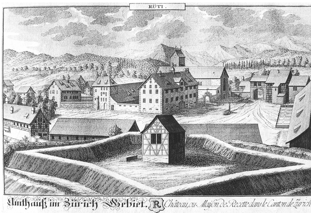
Abb. 1: Das Amtshaus Rütli mit dem ehemaligen Klosterbezirk, Zentrum einer weitläufigen Verwaltung, Kupferstich von David Herrliberger, um 1740. Die Schanze im Vordergrund erinnert an die exponierte Grenzlage des Gebäudekomplexes.