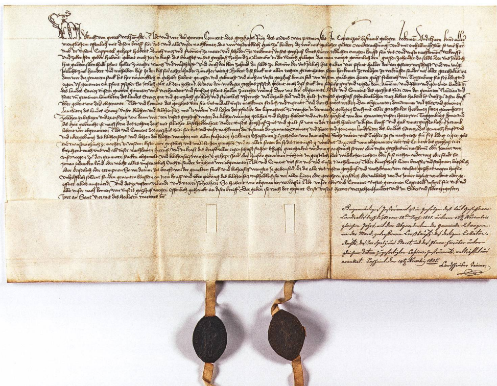
Abb. 2: Staatsarchiv Schwyz, Urkunde, Nr. 602 (STASZ, HA.II.602). Eine mittelalterliche Güterbereinigung: 1477 verkaufte Rüti für die eher bescheidene Summe von 450 Pfund dem Land Schwyz die Kirche Wangen mit zahlreichen Einkünften, so Zehntrechten zu Betttau und Käseabgaben vom Wägital.

Rüti, Sebastian Hegner, im Frühling 1557 nach Rapperswil flüchtete, sich demonstrativ wieder zum alten Glauben bekannte und als «Conventbrüder des Gotzhaus Rüti» das Kloster wenigstens symbolisch weiterführte. 16 Sein Tod am 10. November 1561 dürfte in Zürich für grosse Erleichterung gesorgt haben. Der Rat hatte zwar 1525 das Kloster in ein Amtshaus umfunktioniert, das auf wirtschaftlicher Ebene die mittelalterliche Institution weiterführte, konnte aber erst 1559 nach einem Vertrag mit Hegner alle Rechte übernehmen und sich nach dem Tod des letzten Chorherrn wirklich im alleinigen Besitz des Klosters sehen.