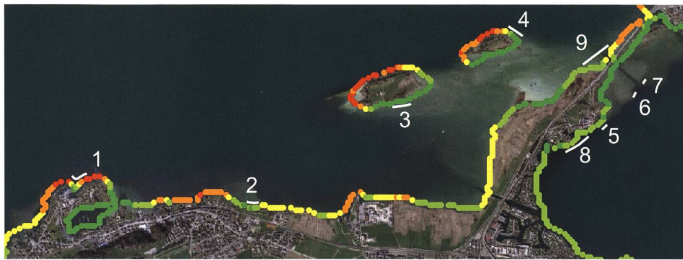
Abb. 3: Exposition der prähistorischen Fundstellen auf Schwyzer Kantonsgebiet im Oberen Zürichsee und Obersee: 1: Freienbach-Bächau; 2: Freienbach-vor der Kirche; 3: Freienbach-Ufnau; 4: Freienbach-Lützelau; 5: Freienbach-Hurden Kapelle; 6: Freienbach-Hurden Untiefe West; 7: Freienbach-Hurden Seefeld; 8: Freienbach-Hurden Rosshorn.

einem spezifischen naturräumlichen Kontext steht, in dem jeweils wechselnde hydrodynamische Bedingungen und Strömungen herrschen. Zudem sind Messungen, wie sie in Freienbach-Hurden Seefeld durchgeführt wurden, aufwändig und zeitintensiv und müssen vor Ort erfolgen.