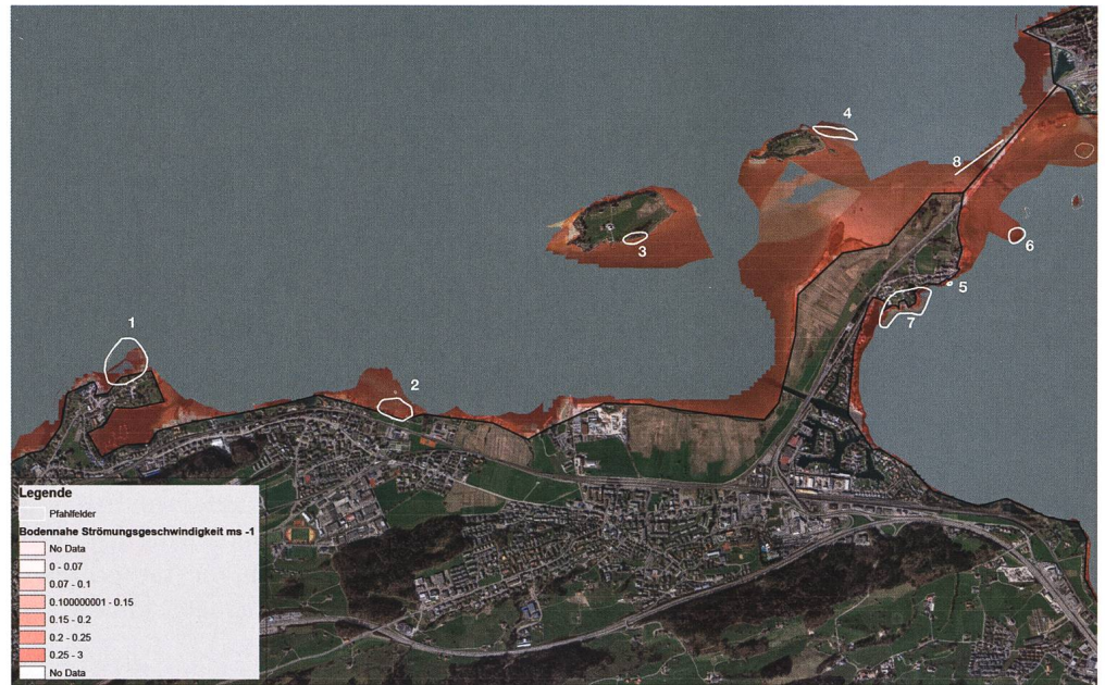
Abb. 4: Darstellung der bodennahen Strömungsgeschwindigkeiten.

Sedimentpartikel aufgewirbelt und können transportiert werden: Es findet Erosion statt, die die Substanz von archäologischen Fundstellen abbaut. Dass diese Werte bei allen ufernahen Fundstellen des Kantons Schwyz erreicht und teilweise deutlich übertroffen werden, zeigt sich in der differenzierten Darstellung des Jahresmittels der bodennahen Strömungsgeschwindigkeiten. Es liegt auf der Hand, dass einzelne Sturmereignisse viel grössere Strömungsgeschwindigkeiten erreichen und damit die Erosion wesentlich erhöhen: Je nach Windrichtung sind einzelne Fundstellen dann besonders exponiert. Die Modellierung zeigt bei östlichen Winden die besondere Exposition der Fundstellen Freienbach-Hurden Kapelle, Freienbach-Hurden Untiefe West und Freienbach-Hurden Seefeld. Bei Winden aus westlicher und nördlicher Richtung sind diese besser geschützt, während in den Flachwasserzonen zwischen Ufnau, Lützelau und Hurdener Landzunge Strömungsgeschwindigkeiten von 0.3–1 m/s auftreten können.