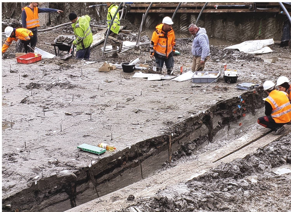
Abb. 2: In einer Rettungsgrabung in Immensee wurden 2020 mehrere Pfahlbau- beziehungsweise Kulturschichten (dunkle Schichten) dokumentiert.

Obersees konnten 1998 auch die Schwyzer Gewässer – im Auftrag des Kantons Schwyz – gezielt nach Hinweisen auf prähistorische Ufersiedlungen abgesucht werden. 2 Ziel war es, den Zustand der damals bereits bekannten Pfahlbausiedlung bei Freienbach-vor der Kirche zu kontrollieren sowie Hinweise auf weitere Pfahlbausiedlungen zu finden – mit Erfolg: Beim Abschwimmen der Flachwasserzonen, die aufgrund der untiefen Seegrundtopografie als potenzielle Siedlungsgebiete der prähistorischen Bewohner gelten, entdeckten die Zürcher Taucher mehrere bislang unbekannte Fundstellen. 3