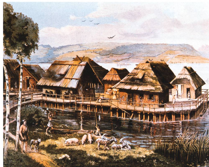
Abb. 1: Auguste Bachelin, «Village lacustre de l'âge de la pierre», 1867.

In unseren Seen und Flüssen befinden sich archäologische Zeugen aus mehreren Jahrtausenden – Mensch und Umwelt haben im Verlauf der Zeit ein Bodenarchiv der Vergangenheit geschaffen, das einmalig ist und es erlaubt, unsere zivilisatorischen Wurzeln zu entdecken. Die Fülle an Informationen dank der Erhaltung von organischen Materialien wie hölzerne Bauelemente von Pfahlbauhäusern, Fischernetze oder Kleidungsstücke, aber auch von nicht-organischen Materialien, Werkzeugen, Schmuck und Alltagsgegenständen, aus der Stein- und Bronzezeit waren der Grundstein für die 2011 erfolgte Ernennung der Pfahlbauten zum Unesco-Weltkulturerbe. Kleinste Pollenreste, verkohltes Getreide, Tier- und Pflanzenreste geben Auskunft zu den Lebensumständen und dem Naturraum der damaligen Bevölkerung. Die Reste der Pfahlbauten haben unter Luftabschluss Jahrtausende überdauert. Sie dokumentieren unsere Kultur- und Naturgeschichte von 4300 bis 800 vor Christus. Mit ihnen lassen sich die Entwicklung jungsteinzeitlicher und metallzeitlicher Siedlungsgemeinschaften im Kontext mittel-, südost- und westeuropäischer sowie mediterraner Kulturtraditionen erforschen. Im