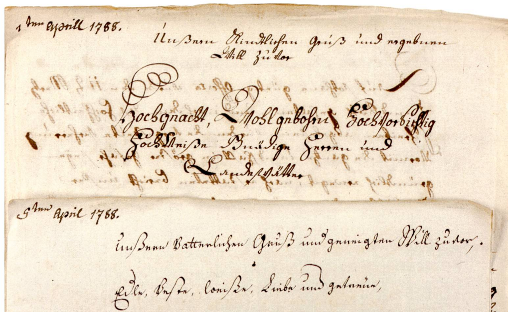
Abb. 2: Stellt man die beiden Anfänge der Briefe einander gegenüber, werden die Parallelen und Unterschiede in den Anreden zwischen «väterlicher Obrigkeit» (unten) und «kindlichen Untergebenen» besonders deutlich.

Die Märchler Antwort 7 auf den daraufhin von Schwyz angeordneten «freiwilligen» Beitrag zeigt neben dem schwierigen Verhältnis zwischen Schwyz und der Landschaft in einer Momentaufnahme den Stand verschiedener eigener Vorhaben. Bauprojekte, die Organisation der militärischen Verteidigung und der Hochwasserschutz waren zwar deutliche Zeichen des Autonomiebestrebens der March, verringerten aber gleichzeitig das «schwache Vermögen». Gesunkene Einnahmen aus der Holzwirtschaft und dem Angstergeld 8 , mangelnde flüssige Geldmittel und die Landesschulden der Märchler, trotz dreier Steuererhebungen in den vorausgegangenen sechs Jahren, standen gestiegenen Aufgaben und Aufwendungen sowie Geldabgaben Richtung Schwyz gegenüber. Trotzdem bemühten sich die Räte in Lachen durch den mehrfachen Hinweis auf das Bild der unterstützungsbedürftigen gehorsamen Kinder und eines hilfsbereiten verständnisvollen Vaters um ein wohlgeordnetes Verhältnis zu Schwyz.