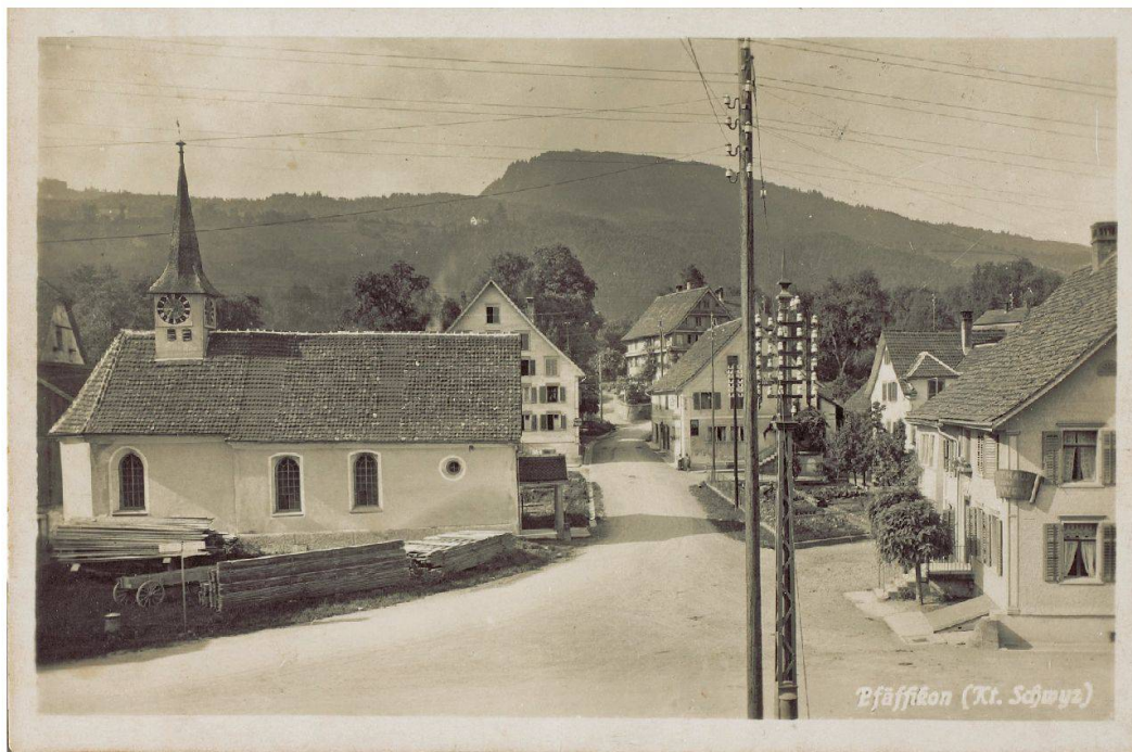
Abb. 2: Pfäffikon (Kanton Schwyz), Dorfmitte (heutige Löwenkreuzung), Blick Richtung Etzel, 1930. Die Kapelle St. Anna (links, 1969 abgebrochen) sowie die Gasthäuser Rössli (im Mittelgrund, rechts von der Strasse) und Löwen (rechts vorne) bildeten Begegnungsstätten und Versammlungsorte von Dorfbewölkerung und -obrigkeit. Die Korruptionsaffäre 1839 war an diesem zentralen Ort mit Sicherheit Gesprächsthema gewesen.