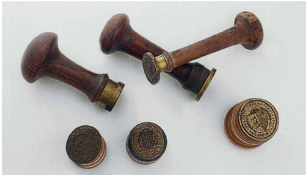
Abb. 3: Siegelstempel (Petschaften) der Bezirke Pfäffikon und Wollerau, erste Hälfte 19. Jahrhundert. In den Kanzleien und Gerichtsstuben der Bezirke Pfäffikon und Wollerau (1803–1848) verwendete man diese Siegelstempel als Verschlussmittel von Briefsendungen und zur urkundlichen Beglaubigung von Schriftstücken. In den Fällen von Betrug und Fälschung in den beiden Bezirken 1839 wurden solche Petschaften aber auch missbräuchlich verwendet.

Stelle einzugeben. Namens der Canzley Wollerau: Dr. Gassmann». 126