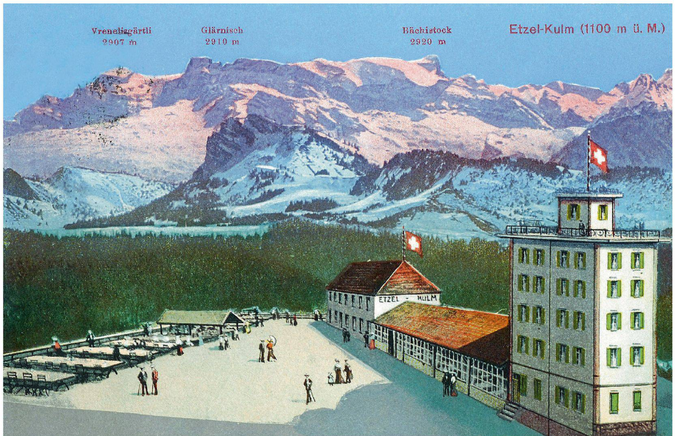
Ansichtskarte mit Gasthaus und dem um 1912 errichteten hölzernen Aussichtsturm mit grosser Dachterrasse sowie idealisierter Darstellung der Aussenanlagen, nach 1912.

hen Turm: «Der Aussichtsturm wird bis zur Höhe von 36 Meter als massiver Steinbau errichtet und es beträgt die Dicke der Mauern im Fundament 1\frac{1}{2} m; hierbei kommt dem Erbauer das reichhaltige Steinlager auf eigenem Grund und Boden sehr zu Nutzen, indem die Bausteine in nächster Nähe des Turmes gebrochen und mittels Schmalspurbahn, von kräftigen Zugochsen gezogen, hinaufbefördert werden. Auf die Höhe der Aufmauerung kommt sodann ein aus Glas und Eisen konstruierter Pavillon, welcher Platz für 150 bis 200 Personen bieten und gegen Wind und Wetter schonen soll. In den untern Stockwerken werden die Restaurations-, Lese- und sonstige Lokalitäten eingerichtet.» Ein recht gigantisches Projekt war da geplant. Der Bau sollte immerhin doppelt so hoch wie der Schlossturm in Pfäffikon werden. Offensichtlich war man bei der Planung und Ausführung des Steinturms nicht sehr sorgfältig, denn am 31. Juli 1901 stürzte das Bauwerk ein.