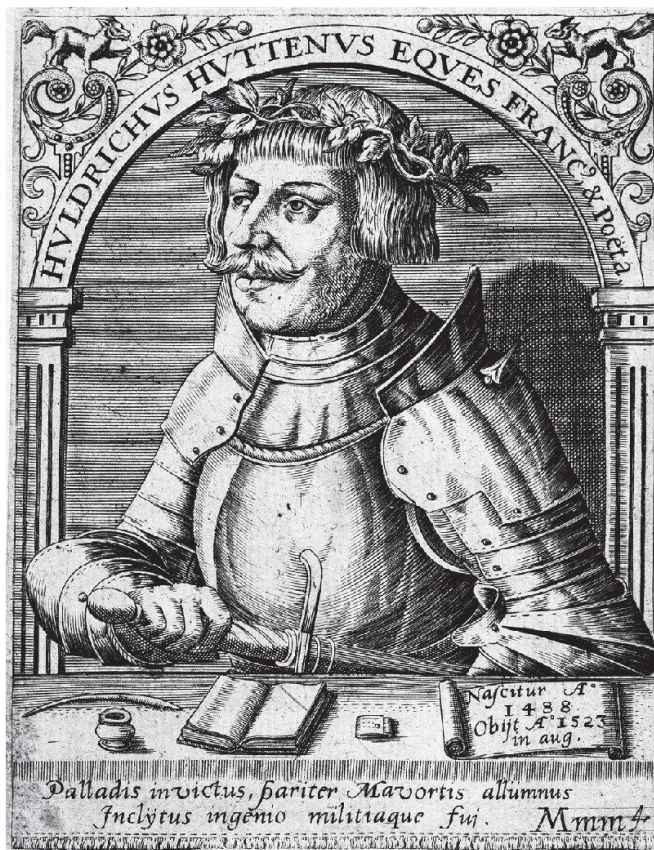
Ulrich von Hutten (1488–1525), der streitbare Dichter und Kritiker.

Die Abkürzungen von der Ufenau und damit die Bildung selbstständiger Pfarreien begründeten die Pfarrkinder hauptsächlich mit der mühseligen und je nach Witterung