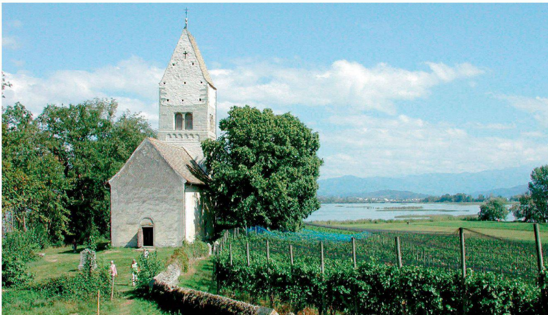
Die Insel Ufenau mit der Kirche St. Peter und Paul im frühen 19. Jahrhundert (Aquatinta) und im frühen 21. Jahrhundert.