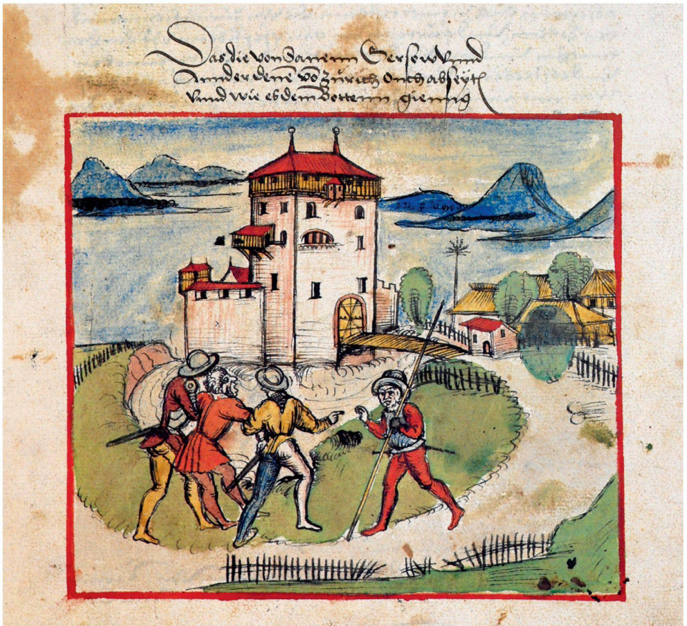
Die älteste Abbildung des Schlossturms von Pfäffikon findet sich in der Eidgenössischen Chronik von Wernher Schodoler, verfasst im frühen 16. Jahrhundert.