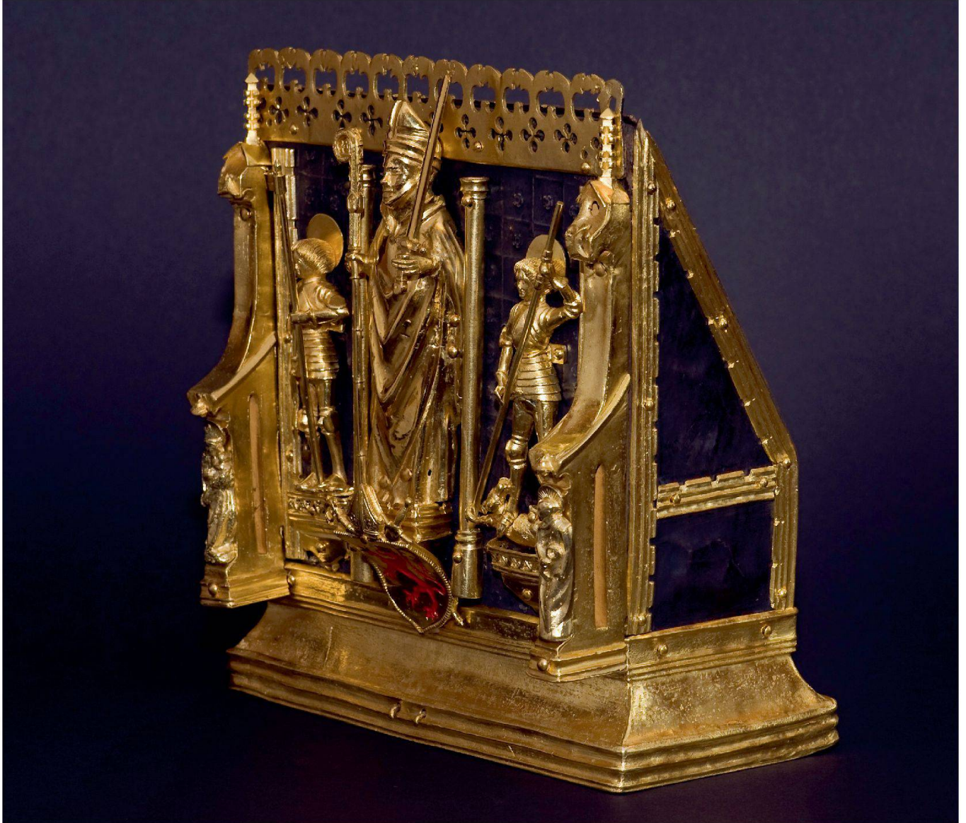
Reliquiar des Jost von Silenen: Silber- und Kupferlegierung auf Holzturm, gegossen, getrieben, ziseliert und teilvergoldet (19 x 17 x 10 cm).