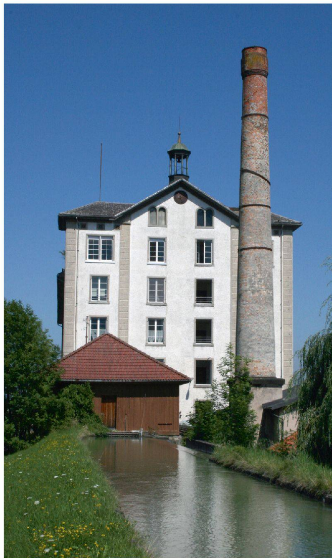
Die ehemalige Spinnerei Honegger in Siebnen.