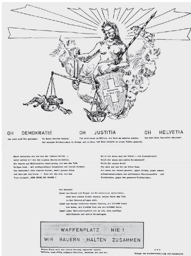
Ein Plakat der Gegner des Waffenplatzes Rothenthurm aus dem Jahr 1980. Die Waagschale der Justitia neigt sich zu Gunsten des Waffenplatzes.