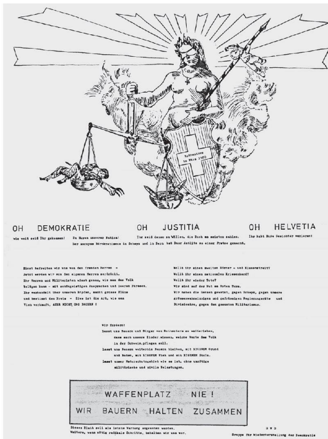
Ein Plakat der Gegner des Waffenplatzes Rothenthurm aus dem Jahr 1980. Die Waagschale der Justitia neigt sich zu Gunsten des Waffenplatzes.