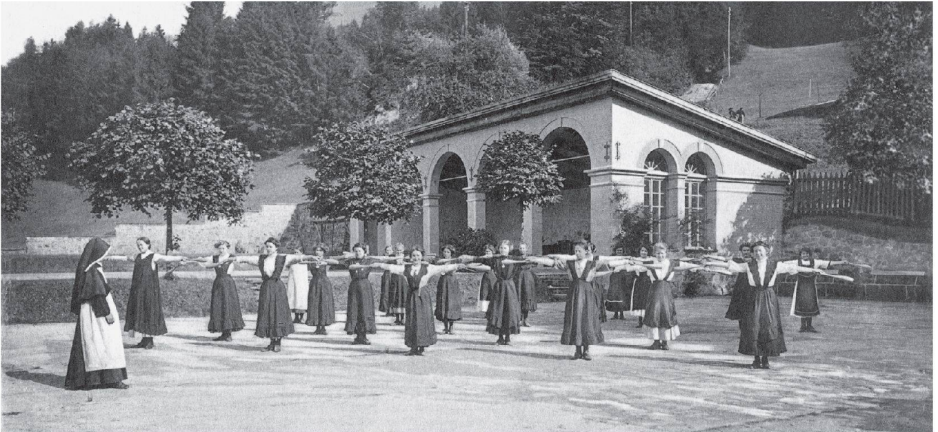
Turnunterricht im Theresianum Ingenbohl in der Frühzeit der Lehrerinnenausbildung.

oder in Gefängnissen ausgeübt. Die 1894 vom Papst offiziell anerkannte Kongregation gründete auch Missionen. Die erste Mission führte nach Indien (1894), es folgte eine Mission in China (1927–1945) und in Brasilien (1966). Auch während der beiden Weltkriege waren die Schwestern karitativ tätig. Sie richteten Lazarette ein, wo sie die verwundeten Soldaten beider Seiten pflegten. Es waren fünf Krankenstationen in der Schweiz, 122 in Böhmen, Ober- und Niederösterreich, Slawonien, Steiermark, Mähren, Baden, Tirol und Ungarn.