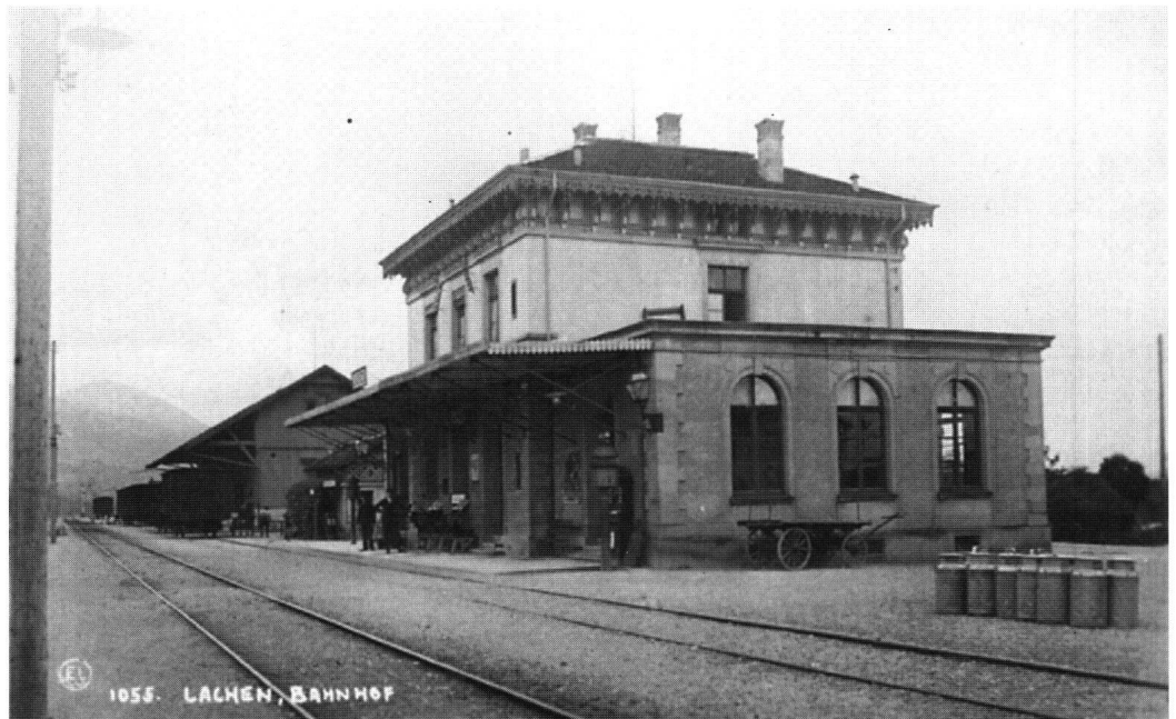
Abb. 1: Der Bahnhof von Lachen, 1875 erbaut, in einer Aufnahme um 1900.

Die Streckenführung und der Stationsbau der Nord-Ost-Bahn-Gesellschaft erregten aber auch die Gemüter. Vom neuen Verkehrsmittel wollten möglichst alle Dörfer profitieren. Diesem Wunsch konnte nicht entsprochen werden. Bekannt ist der unerfüllte Wunsch von Tuggen und Schübelbach, eine eigene Station zu erhalten. 22 Die Lokalpresse vom 9. Oktober 1875 berichtet von Anschlägen und Sabotageakten auf die Schienen in der Obermarch. Das Bezirksamt ermittelte gegen einen Peter Bruhin, genannt «Holländer», welcher aus Verärgerung über den nicht gewährten Bahnhof Schübelbach die Schienen gelöst hatte. Auch der Schreiber der Drohbriefe an die Direktion der Nordostbahn konnte zur Rechenschaft gezogen werden. Franz Xaver Benz im Schorrenhof zu Tuggen verfolgte mit seinen Drohschreiben das gleich Ziel wie Bruhin. 23