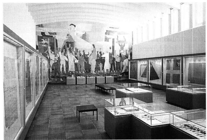
Der Bundesbriefsaal im Lauf der Zeit (1936–1979, 1980–1998 und ab 1999).