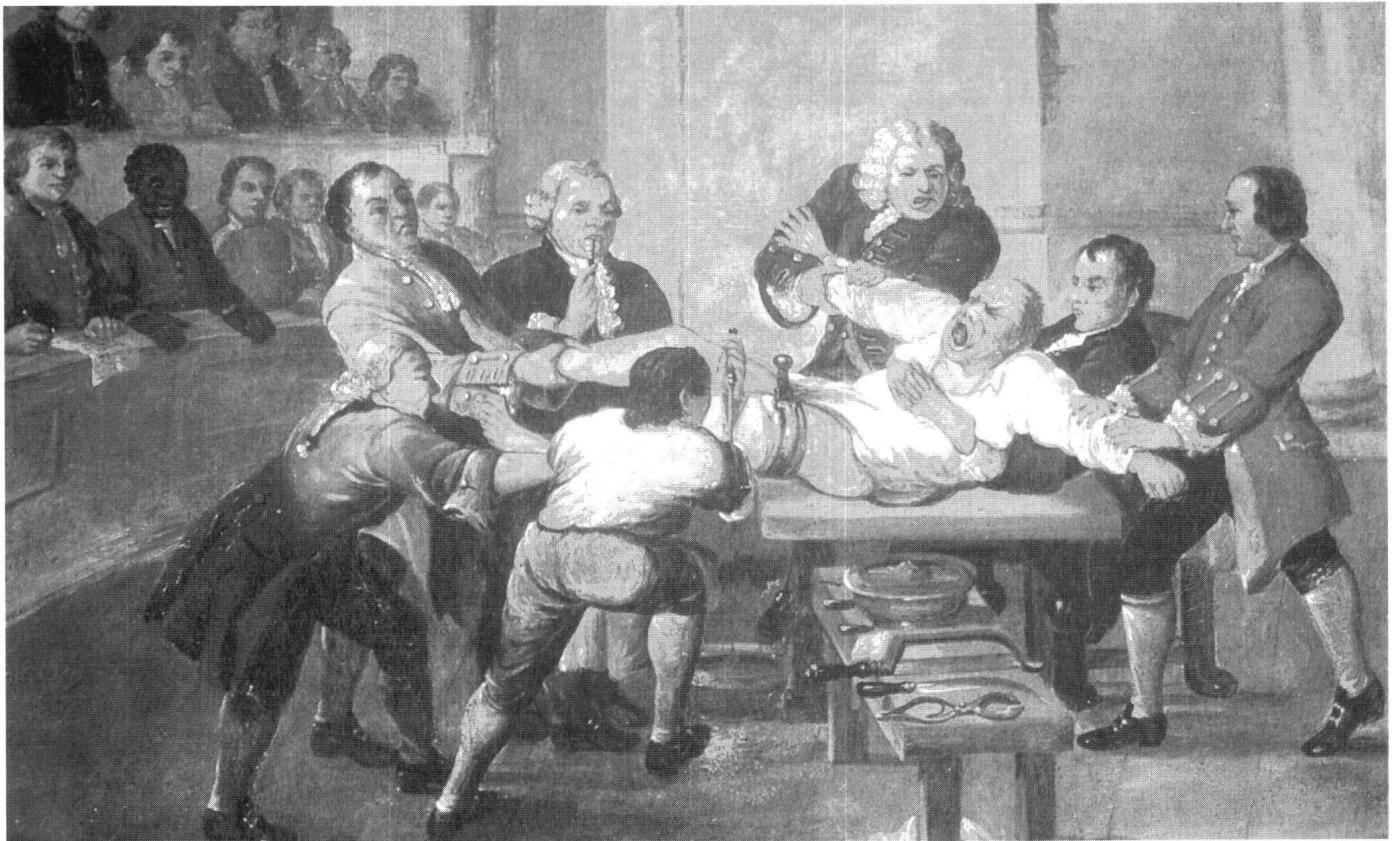
Abb. 1: Beinamputation. Realistische Darstellung eines unbekanntem Künstlers aus der Mitte des 18. Jahrhunderts. Der schwarze Mann in der Studentengalerie ist nicht etwa ein Sklave, sondern Omai, ein damals berühmter Mann aus Polynesien, der London von 1774 bis 1776 besuchte und mit Kapitän Cook heimkehrte. Das Tourniquet liegt fest am Oberschenkel, der Zirkelschnitt beginnt, die Knochensäge liegt bei den anderen Instrumenten griffbereit. Trotz der Abbindung sind die Schmerzen enorm, wie die Reaktion des Patienten deutlich zeigt.