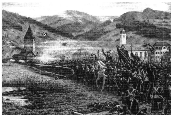
Abb. 2: Darstellung von Evert-Louis van Muyden. Der Sieg im Abwehrkampf an der alten Letzi zu Rothenthurm fiel eindeutig den Schwyzern zu. Die Franzosen wurden zurückgeworfen und verfolgt. Zu hoch waren die Verluste der Schwyzer dennoch, um gegen die grosse Übermacht erfolgreich weiterzukämpfen.

Anhand der Liste der Toten und Verwundeten von Zschokke versuchte ich, die Verwundeten zu identifizieren. Es fiel oft nicht leicht. Die Angaben zu den Personen sind gelegentlich zu vage und oft zu unterschiedlich. Tabelle 6 bietet den alphabetischen