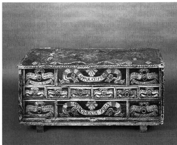
Abb. 3: Feldkiste eines Zürcher Feldscherers mit Fächern für Instrumente, Medikamente und Bandagen, um 1700.

Interessant ist der Hinweis auf die Feldapotheke, die er nach Küssnacht, Rothenthurm und nach Schwyz brachte. Dies belegt, dass auch in Schwyz Medikamente und Verbände für die Verwundeten vorbereitet und wohl in Kasten vorhanden waren. Bekannt ist der Inhalt der Bulgen Zürichs von 1792. Dieses Instrumentarium der Ärzte und Feldscherer weist auf die Behandlungsarten und Therapiemöglichkeiten hin. Der Exkurs zum Inhalt der Bulgen Zürichs mit Instrumenten und Medikamenten lohnt sich daher. Jener ins Inventar des Spitals zu Schwyz enttäuscht zunächst, deckt jedoch die Organisation und deren Mängel auf.