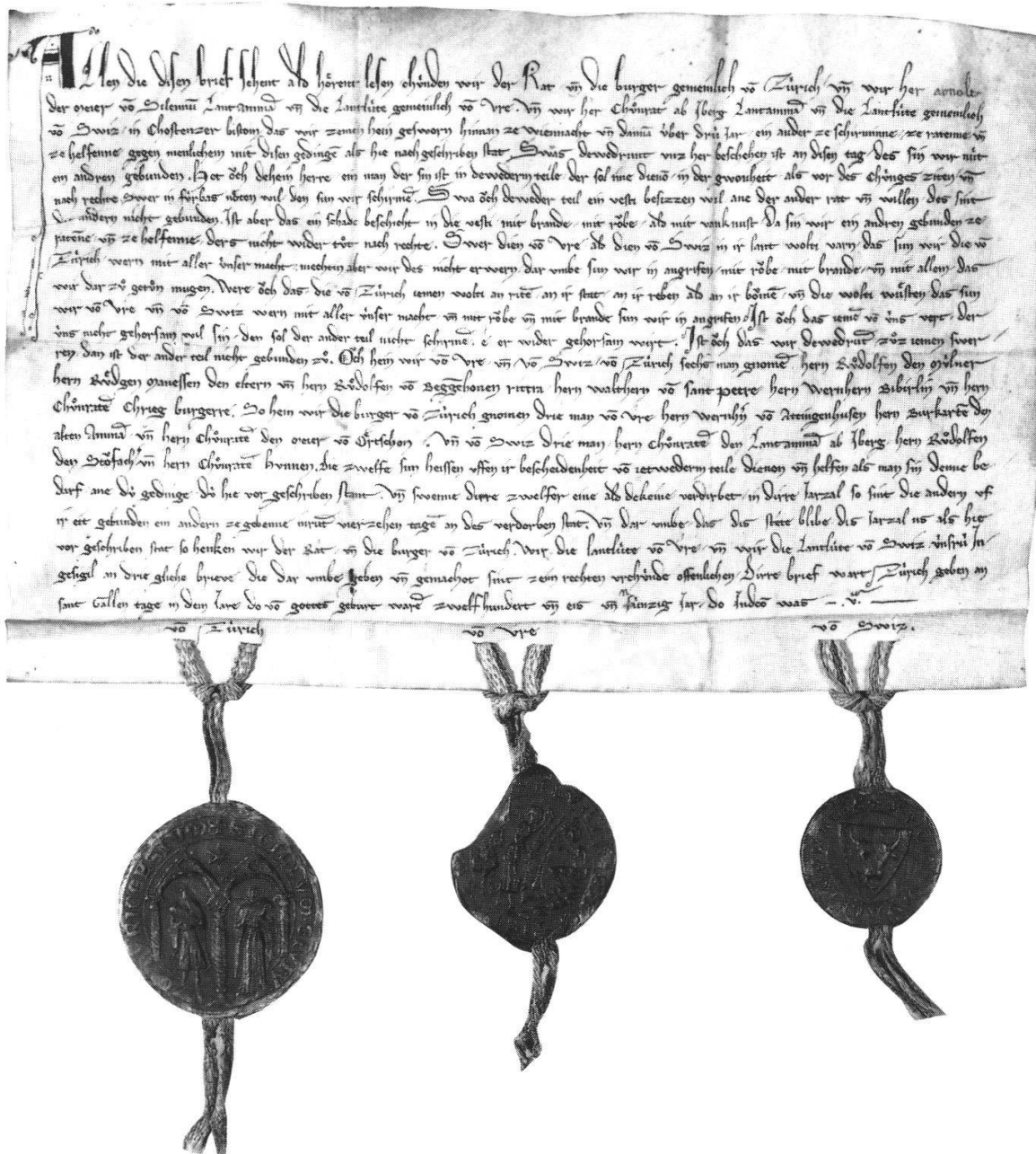
Dreijähriges Bündnis zwischen Zürich, Uri und Schwyz vom 16. Oktober 1291, Siegel entgegen der originalen Anschrift in umgekehrter Reihenfolge angebracht (Schwyz vor Uri).

spezialisierten Kulturen im Reseau der Stadt, waren im Beziehungsfeld Zürich – Schwyz wichtig. Zürichs Sorge um den Rebbau ist in dem dem kleinen Bund von 1291 etwa gleichzeitigen Richtebrief breit verankert, wurde hier die heimische Produktion doch marktpolitisch vor einer hemmungslosen Zufuhr fremder («elender») Weine geschützt. Auf eben diesen Richtebrief, das Grundgesetz der Stadt, sollten sich die Verantwortlichen wieder berufen, als sie im Vorfeld des Alten Zürichkrieges 1437 die Passage fremder Weine nach der Innerschweiz unterbanden. «Den gröst und best nutz, den unser statt und der gantz zürichsew hat, ist an reben ...», so lautete damals die Argumentation zum