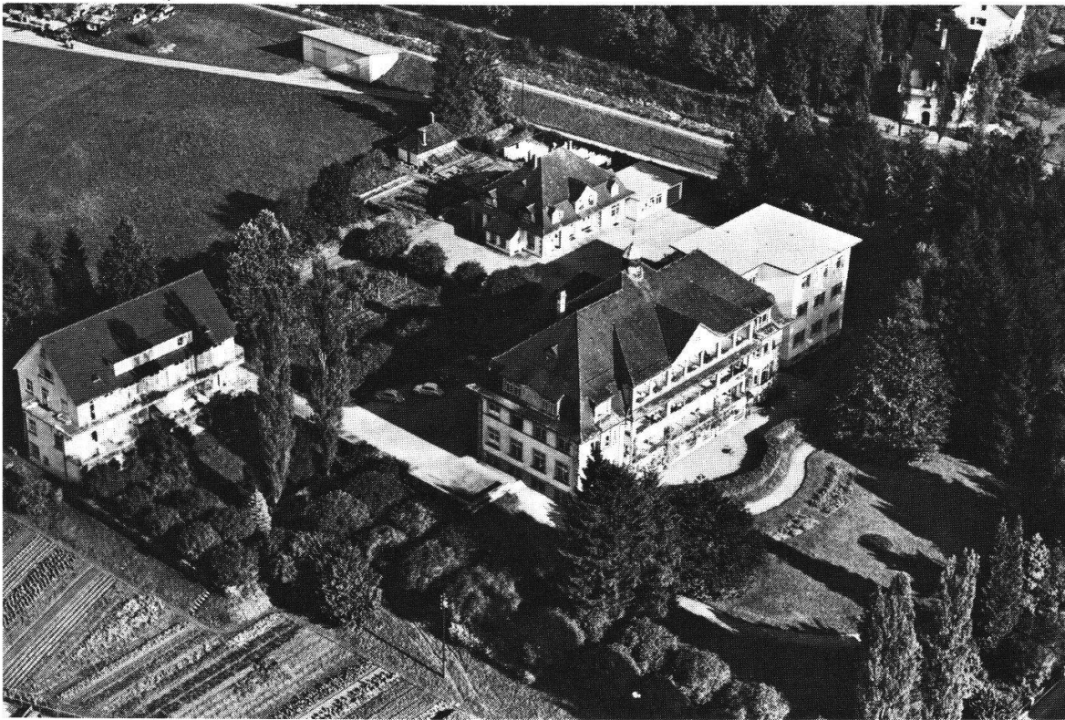
Bezirksspital Lachen. Aufnahme der Gesamtanlage von 1960.

rungen zu treffen, um später eine Rheumastation einzubauen. Ein Landsgemeindebeschuß von 1954 bewilligte nochmals einen Zusatzkredit, der auf die Ausstattung dieser Rheumastation hinzielte.