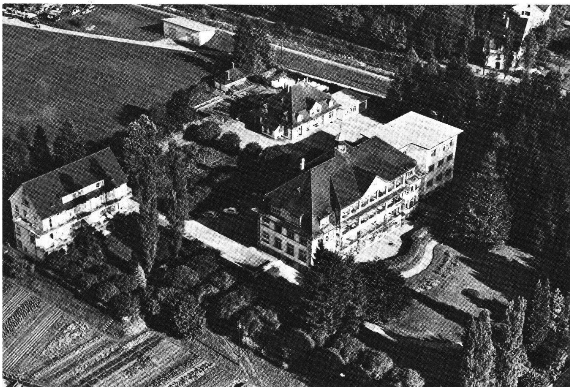
Bezirksspital Lachen. Aufnahme der Gesamtanlage von 1960.

rungen zu treffen, um später eine Rheumastation einzubauen. Ein Landsgemeindebeschuß von 1954 bewilligte nochmals einen Zusatzkredit, der auf die Ausstattung dieser Rheumastation hinzielte.