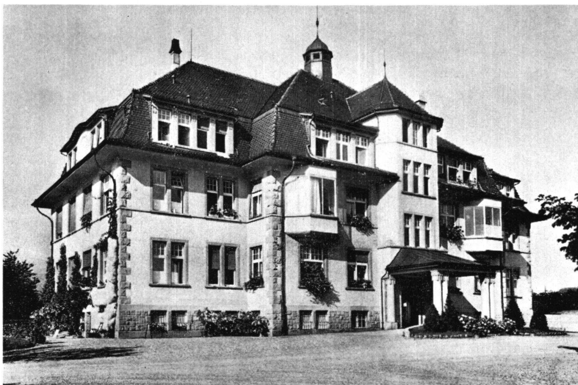
Der Spitalneubau von 1912/15. Hauptgebäude Nordfront.

versität Zürich und von Architekt Zuppinger lautete auf den Bauplatz «Spreitenbach» Lachen. Die Gemeindeversammlung Lachen offerierte zudem die Gratisabgabe des Baugrundes für das Bezirksspital und die Zufahrtsstraßen sowie die unentgeltliche Lieferung des Quellwassers. Die Lachner gaben auch ihren Separatfonds von 17 000 Franken heraus.