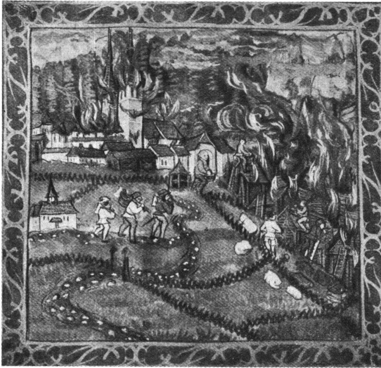
Der Luzerner Diebold Schilling zeigt in seiner Schweizer Bilderchronik den Brand von Kloster und Dorf Einsiedeln im Jahre 1509.

in seiner Geschichte den Verlust kaiserlicher und königlicher Urkunden und Diplome, wie auch, «daß dannoch viel weltlicher Hausrat zu Grunde gegangen».