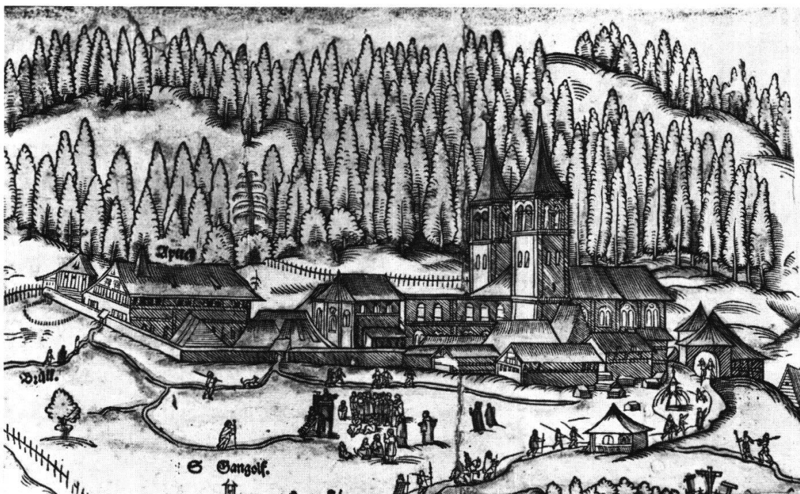
Der Ausschnitt aus der Sammlung Wickiana, Zürich, zeigt deutlich, dass das obere Münster nach dem Brand von 1577 noch nicht wiederhergestellt ist.