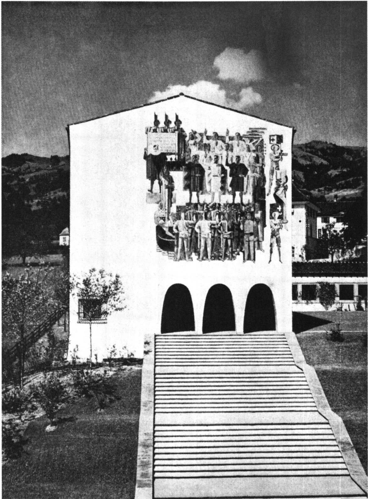
Das neue Bundesbriefarchiv in Schwyz mit dem Wandbild «Fundamentum» von Heinrich Danioth.