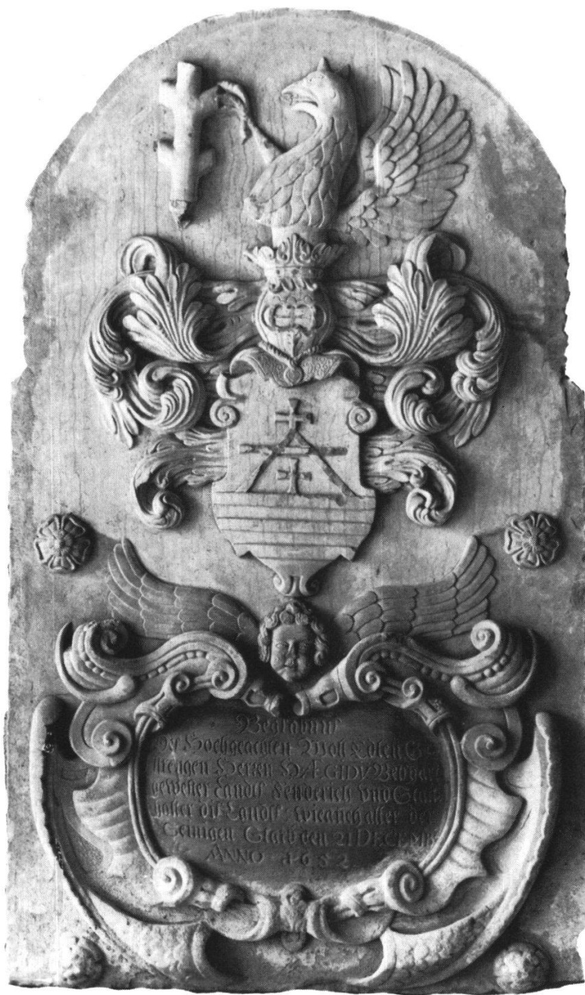
Epitaph des Landesstatthalters Gilg Betschart, † 1651, ehemals in der Familiengruft.