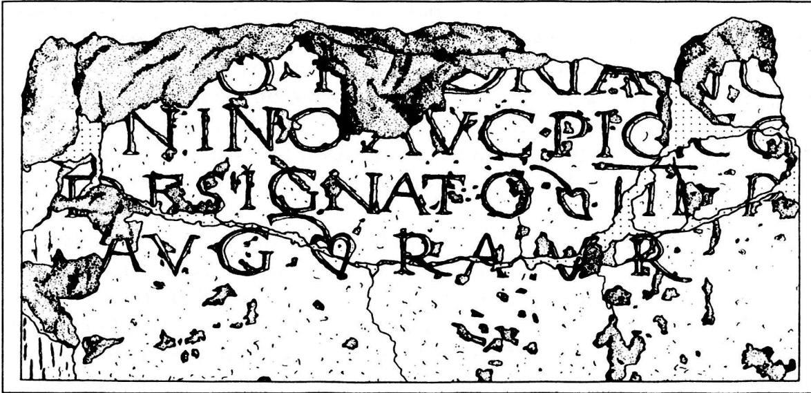
Abb. 2. Nachzeichnung der Meilenstein-Inschrift des Kaisers Antoninus Pius (aus Hans Sütterlin, «Miliaria in Augusta Raurica», Jahresberichte aus Augst und Kaiseraugst 17, 1996, 81).

Fundort: Augst BL, Hohwartstrasse . Funddatum: 10. April 1995 . Standort: Römermuseum Augst, Gross-Steinlager . Material: Kreidiger Rauracienkalk . Erhaltungszustand: Der obere Teil der Säule fehlt. Auf der Rückseite und im Sockelbereich ist sie beschädigt. Die Inschrift weist mehrere z.T. durchgehende Risse auf. Die Rückseite der Säule ist im Gegensatz zur geglätteten Oberfläche des Inschriftenfeldes roh belassen . Masse: Höhe mit Sockel 158 cm, Durchmesser 54 cm, Sockelhöhe 25 cm . Schriftfeld: Breite abgerollt 120 cm . Buchstabenhöhe: 5,5–6,3 cm .