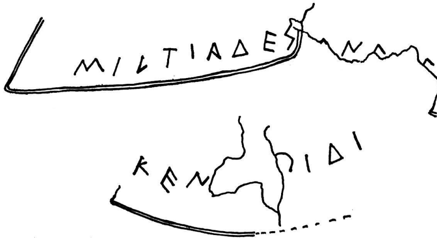
Μιλτιάδης ἀνέ[θ]έκεν [: τ]ῶι Δί