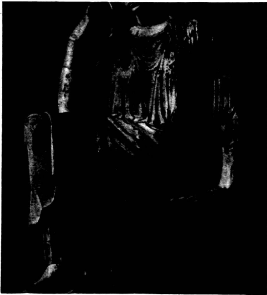
Abb. 3. Vatican.