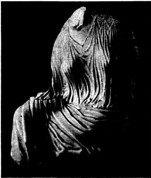
Abb. 1. Persepolis.