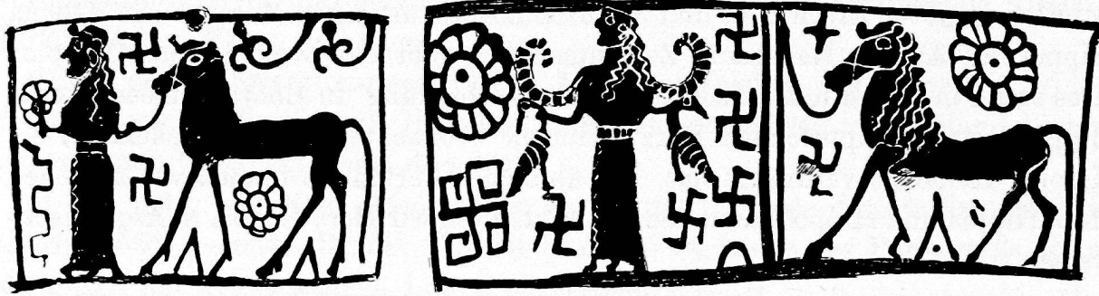
Abb. 13 (zu S. 80).

des Gefäßes und ist mit ähnlichen Füllornamenten versehen, wie sie sich auf Nr. 1 finden.