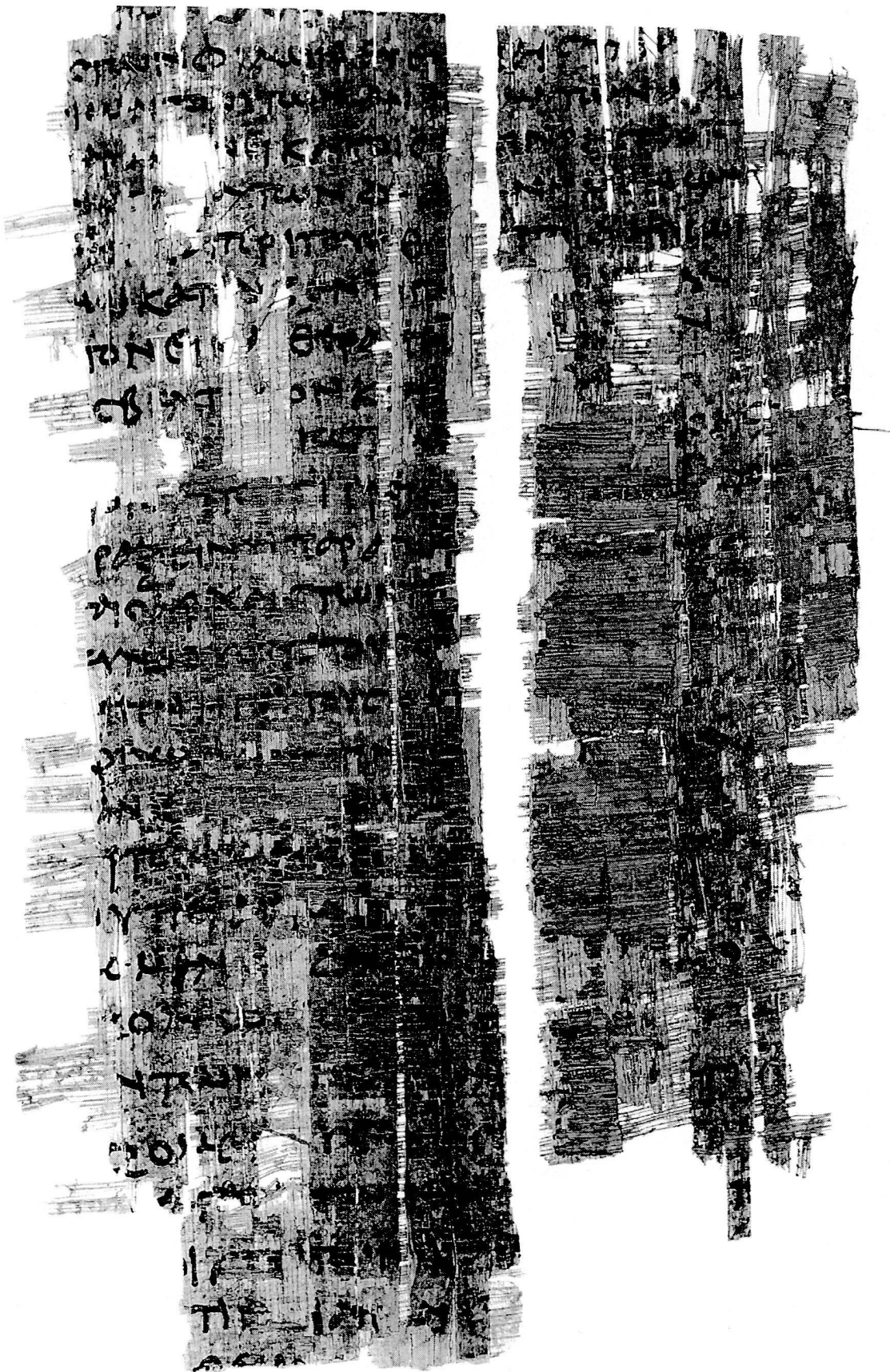
Planche 2 P. Bodmer LII verso, collection Martin Bodmer, Cologny (Genève)