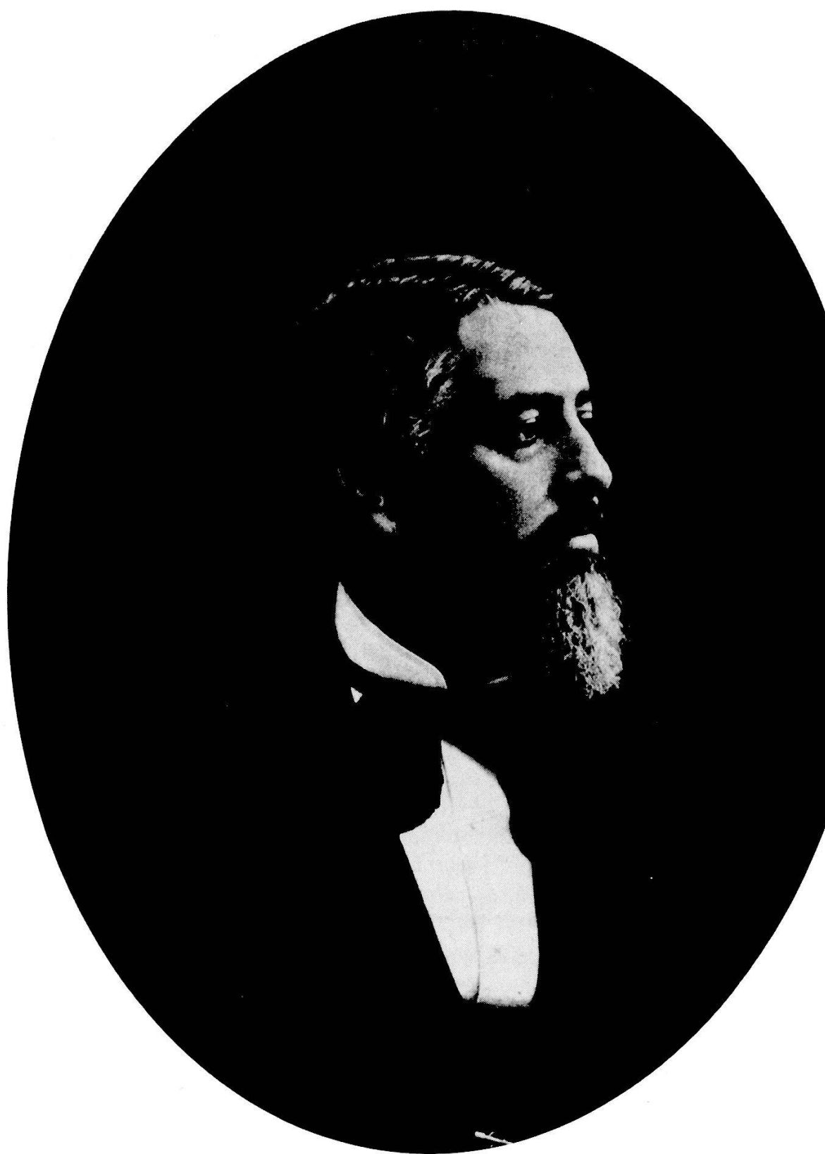
Planche I François Lenormant (1837-1883)