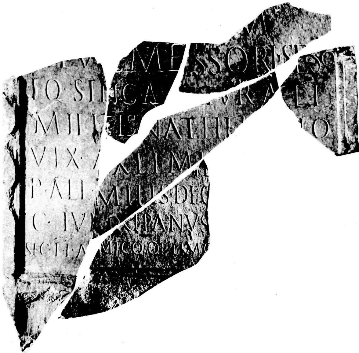
Tafel 1. Grabinschrift des C. Iulius Messor , aus 6 Bruchstücken zusammengesetzt (s. Abb. 1)