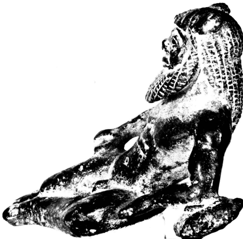
4. Bronzesilen aus Olympia, Schrägansicht.