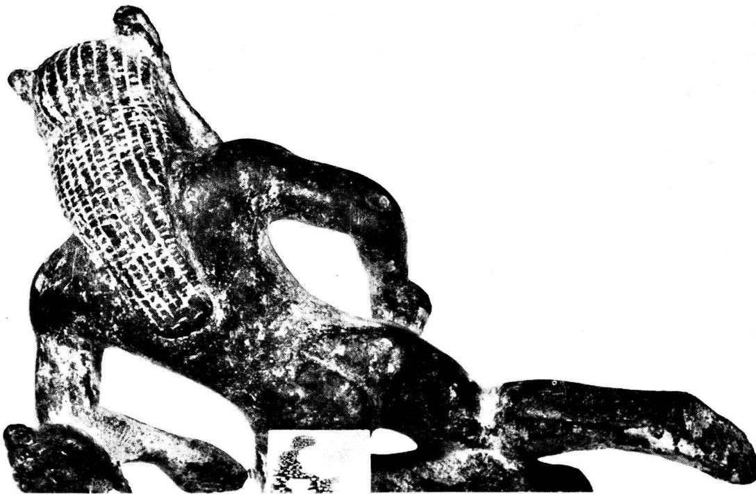
2. Bronzesilen aus Olympia. Rückansicht, L. 8,0 cm, H. 5,1 cm.