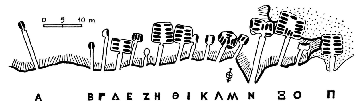
Fig. 2. La nécropole de Mazarakata (d'après P. Kavvadias).

en revanche, fondée sur une identification qui ne laisse guère de place au doute, elle présente un haut degré de probabilité. Mais, pour que cette probabilité se mue en certitude, il reste encore à montrer que les fouilles pratiquées à Mazarakata, loin d'exclure la possibilité d'une première exploration du site vers 1812, rendent au contraire inéluctable la conclusion vers laquelle nous nous sommes acheminé.