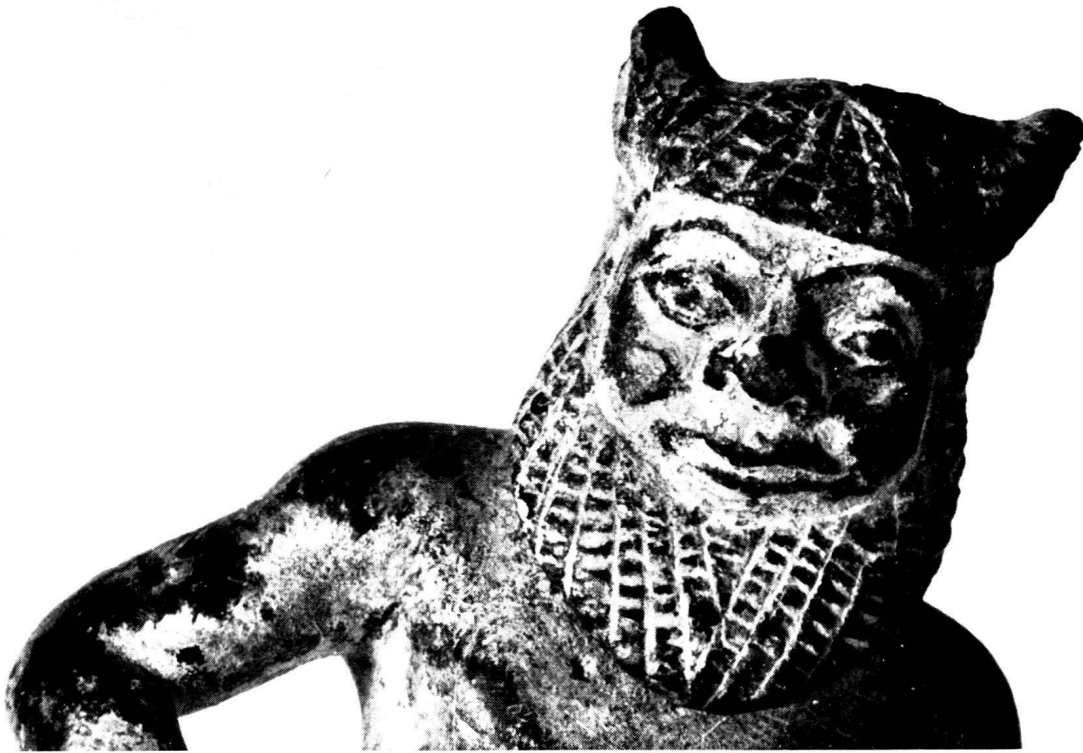
3. Bronzesilen aus Olympia, Detail.