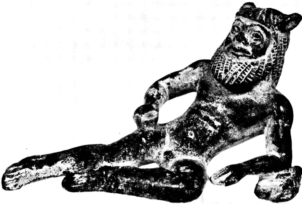
1. Bronzesilen aus Olympia, Slg. Bührle, Zürich.