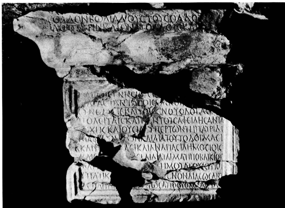
Fig. 1. Face antérieure.

lorsque les quatre tribus ne sont pas mentionnées expressément, c'est-à-dire lorsque l'offrande est faite par d'autres dédicants, caravane ou Etat – cette habitude doit être mise en rapport, semble-t-il, avec l'existence de ces quatre tribus qu'on