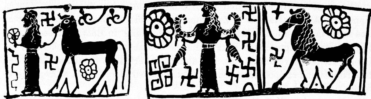
Abb. 13 (zu S. 80).

des Gefäßes und ist mit ähnlichen Füllornamenten versehen, wie sie sich auf Nr. 1 finden.