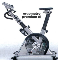
ergometro premium 8i