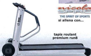
tapis roulant premium run8