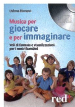
Hinnawi, U.: Musica per giocare e per immaginare . Roma: Red Edizioni, 2010.

Questo Cd propone un percorso studiato appositamente per stimolare l'immaginazione e la creatività dei bambini e per favorire la loro distensione. Una voce guida discreta e rassicurante invita i piccoli a prestare attenzione a forme, materiali, suoni e profumi che li circondano, aiutandoli ad acquisire, in modo allegro e divertente, una maggiore consapevolezza dei cinque sensi. Altri percorsi conducono i bambini in viaggi fantastici che, partendo da un certo tema (i quattro elementi, la natura, i colori, ...), stimolano i piccoli a guardare con occhio nuovo i fiori, gli animali, le nuvole, il mare, che, sotto lo stimolo potente dell'immaginazione, acquistano una veste del tutto inaspettata e sorprendente. Sei esercizi guidati per aiutare i nostri bambini a entrare in contatto con la loro energia più vera e spontanea.