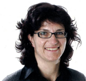
Care lettrici, cari lettori

Le riviste non sono diverse da noi: anche per loro gli anni passano. E l'età ha i suoi vantaggi: le malattie dell'infanzia sono solo un ricordo lontano, si può contare su una certa esperienza e lo slancio iniziale si è consolidato. «mobile» festeggia i suoi primi dieci anni di vita. Auguri e complimenti. E come è d'uopo per ogni compleanno degno di nota si è messo l'abito migliore e si è tirato a lustro.