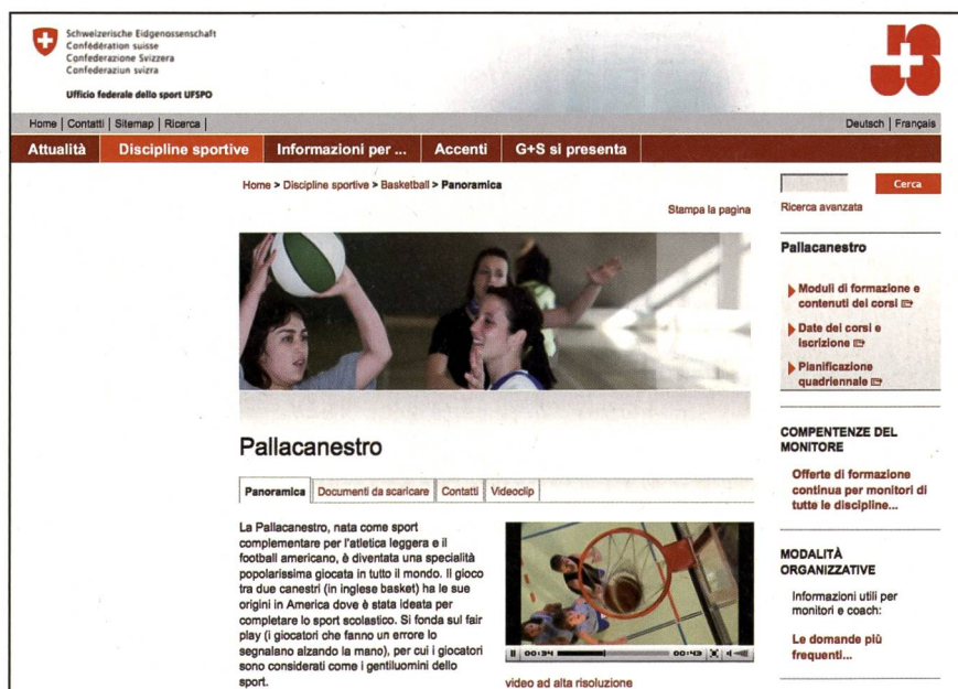
Fig. 3: i filmati offrono un primo sguardo sulle varie discipline sportive. Altri documenti da scaricare sono a disposizione degli insegnanti.