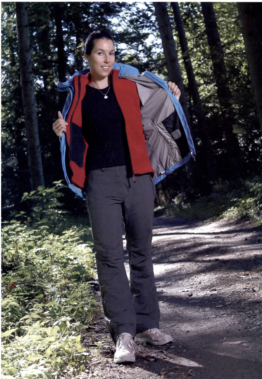
Una tenuta a più strati: il principio della cipolla assicura la massima funzionalità.