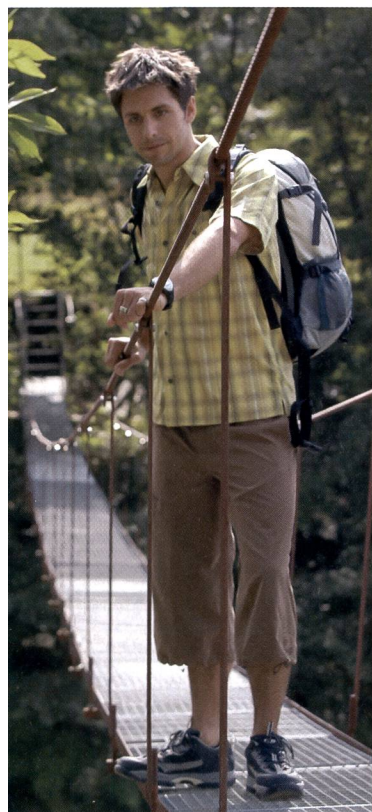
Durante le attività sportive praticate all'aperto e sotto il sole, è preferibile indossare una maglietta di cotone.

■ Attenzione alle mantelline contraffatte. Esse si riconoscono facilmente perché costano molto meno rispetto a quelle originali, il tessuto è di scarsa qualità e sia le cuciture che le cerniere non sono plastificate. //