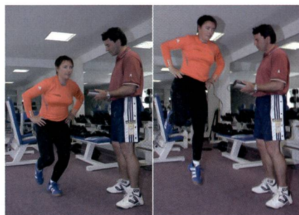
Il sensore è collocato in modo verticale sulla cintura.

Esecuzione: estensione dinamica della gamba di ricezione. Ripetere l'esercizio 5 volte (pausa di 10 sec. fra ogni ripetizione e prendere in considerazione i 3 migliori risultati).