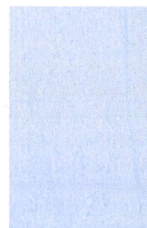
Il myotest registra l'accelerazione verticale ciò che permetterà di dedurre, grazie alla durata di volo, la velocità, la potenza e la forza.

P. Flaction: «La spinta, rispettivamente la frenata di un carico sono due fasi-chiave in molti sport. Aggiungendo dei carichi al movimento di flessione-estensione degli arti inferiori si sollecita l'impiego delle fibre rapide necessarie a fornire una prestazione esplosiva. Un buon dosaggio delle componenti di carico in funzione degli obiettivi da raggiungere permette alla prestazione muscolare di progredire in modo significativo.