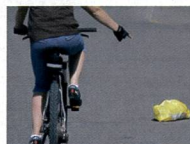
Attenzione, oggetto o buco sulla strada. Scansarlo!