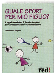
Trapani, G. Quale sport per mio figlio? A ogni bambino il proprio sport per crescere sano e socializzare. Milano, edizioni Red, 2006.

► In un periodo in cui la società prende coscienza dei rischi legati alla sedentarietà e all'obesità infantile, questo libro affronta l'importanza di fare attività sportiva durante l'età evolutiva a scuola, nelle associazioni sportive, ma soprattutto in famiglia.