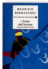
Bernasconi, M. I fiumi dell'anima. In canoa alla scoperta di se stessi. Arnoldo Mondadori Editore, Milano, 2005.

► Il fiume è il percorso sul quale scorrono le pagine di questo libro. Un fiume esplorato e vissuto da Maurizio Bernasconi, noto canoista italiano e profondo conoscitore degli aspetti naturalistici, sportivi e culturali legati ai corsi d'acqua. Illustrando alcune sue escursioni, Bernasconi non offre spunti sulle astuzie tecniche delle discese in kayak, bensì un approccio metaforico collegando il viaggio sul fiume al viaggio della conoscenza. «Se lo risaliamo torniamo all'origine, se lo discendiamo ci porta in vista di un mare nel quale tutti i fenomeni sono destinati a confluire.»