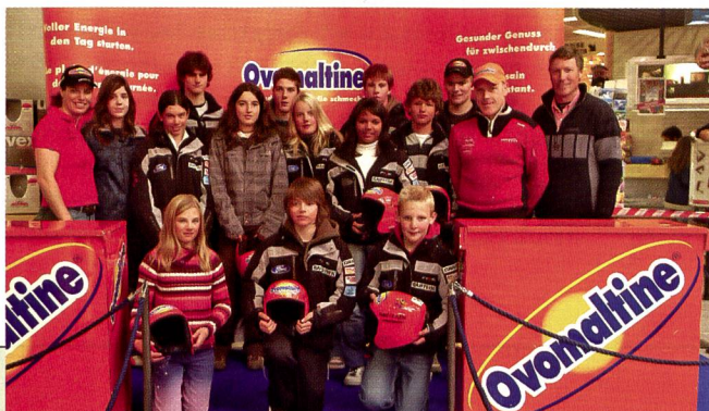
Foto di gruppo per i campioni in erba dello sci vallesano.

Da decenni Ovomaltine s'impegna a favore dello sport invernale e in particolare delle giovani leve. I leggendari Ovo Grand Prix sono stati il trampolino di lancio della carriera per numerosi sportivi d'élite e campioni dello sci come Erika Hess, Paul Accola, Mike von Grünigen, Didier Cuche, Sylviane Berthod, Nadia Styger o Pirmin Zurbriggen, il promotore del progetto «Scuola e sport sulla neve». //