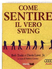
Toski, B.; Love Jr., D.; a cura di Robert Carney: Come sentire il vero swing. Milano, Casa Editrice Scode, 2003.

I paragrafi di testo che caratterizzano questo volume rendono la lettura molto teorica ma nel contempo esplicita e approfondita. Il libro si rivolge ad un pubblico di operatori sportivi, in particolare a chi cura l'aspetto progettuale dell'iter formativo o a chi ha intenzione di completare le proprie competenze didattiche. Doriano Löhner