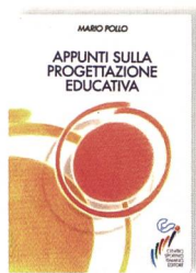
Pollo, M. Appunti sulla progettazione educativa. Roma, Centro Sportivo Italiano Editore, 1996.

► La didattica è il perno attorno al quale ruota la concezione di questo manuale. Il testo elaborato da Mario Pollo, in collaborazione con il Centro Sportivo Italiano, è un valido supporto per l'organizzazione di un corso di didattica per futuri insegnanti, educatori e monitori in ambito sportivo. Dopo un primo capitolo introduttivo sulla natura umana della progettazione, il testo si china sul processo formativo sfruttando ogni capitolo per esporre la normale procedura di una fase d'apprendimento. L'autore parte dalla progettazione educativa come riferimento generale della creazione di una fase d'insegnamento e, in seguito, descrive i processi per una corretta definizione degli obiettivi con il relativo passaggio alla scelta dei compiti. Pollo si sofferma poi sul metodo educativo, attraverso il quale sviluppa il modo corretto per consegnare il compito direttamente nelle mani degli allievi. Questo viaggio didattico si conclude con la presentazione della valutazione formativa atta ad orientare l'allievo sul proprio apprendimento e ad aiutare l'educatore a rielaborare dei nuovi punti di partenza.