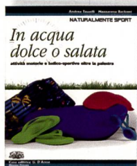
Tasselli A.; Barbieri N.; con la collaborazione di Catalani F.: In acqua dolce o salata. Attività motorie e ludico-sportive oltre la palestra. Casa editrice G. D'Anna, 2006.

Si tratta di un testo molto interessante sia dal punto di vista della struttura sia da quello della ricchezza di contenuti. Si presta molto bene per la preparazione di una settimana bianca, verde o per una semplice gita. Bettina Della Corte Locatelli