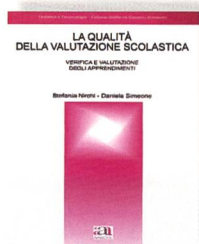
Nirchi, S.; Simeone, D.: La qualità della valutazione scolastica. Verifica e valutazione degli apprendimenti. Anicia, Roma, 2004.