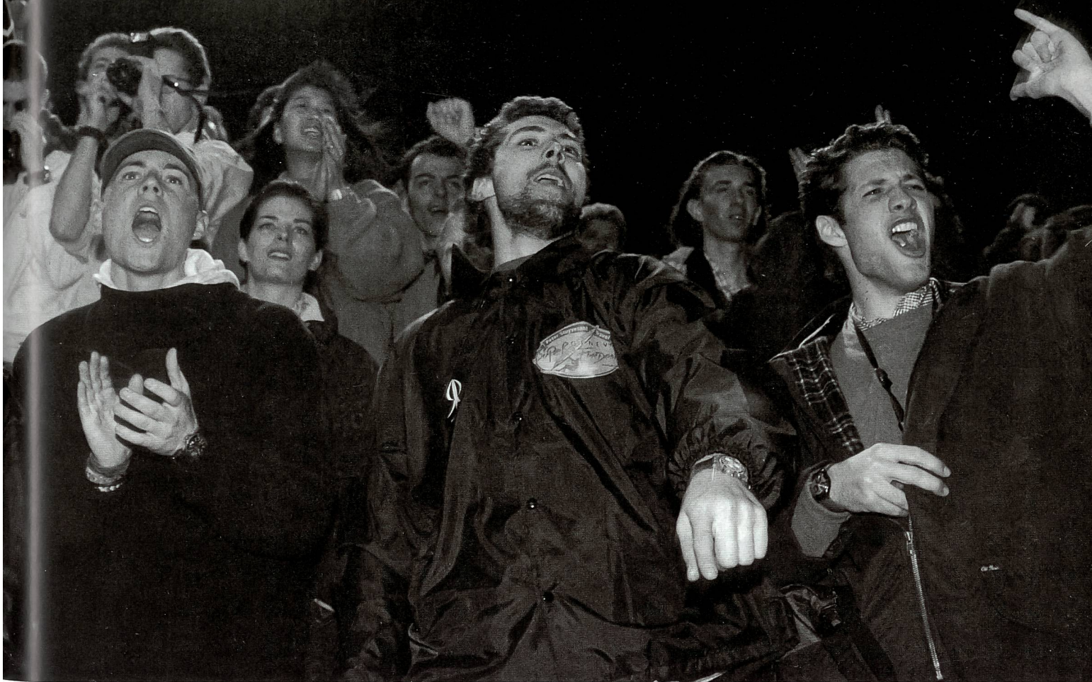
In mondo degli spettatori è tuttora ancora estremamente mascolino.

pidamente resi conto che era più interessante cercare di sedurre un altro pubblico: le donne e le famiglie. Sotto questo aspetto hanno avuto le stesse idee dei dirigenti della FIFA e dell'UEFA, che, da quasi venti anni, cercano di portare le donne negli stadi.