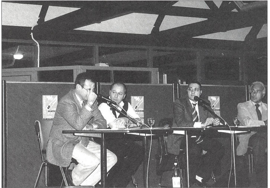
Per conferenze sui problemi dello sport giovanile.

In modo particolare le entrate devono almeno pareggiare i costi relativi alla gestione della pensione (alloggio e vitto) mentre a carico della Confederazione resta la direzione dell'azienda e la gestione dell'impiantistica sportiva.