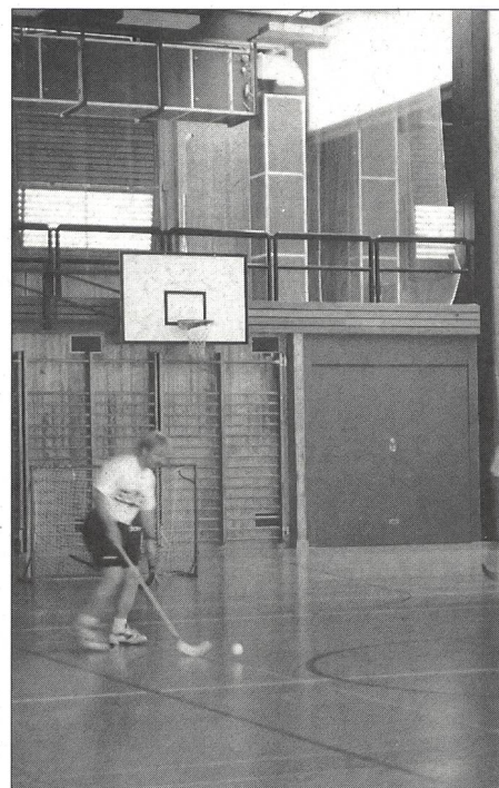
Promozione dello sport giovanile.

L'aumento rispetto allo scorso anno è stato del 2% a comprova di quanto andiamo dicendo da tempo vale a dire che il limite quantitativo di capienza è stato raggiunto e che non è più possibile andare oltre.