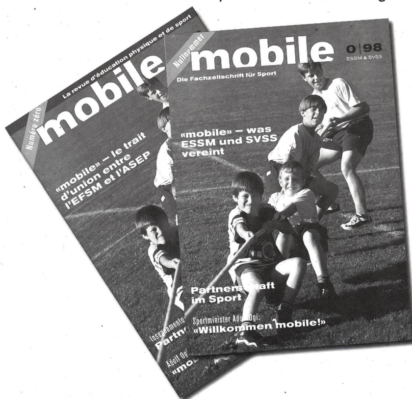
«mobile», la rivista di educazione fisica e sport, vi dà appuntamento alla fine di gennaio.