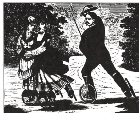
A passeggio, incisione, 19° secolo.

Con l'introduzione del pattinaggio come disciplina G+S, due federazioni affiliate all'AOS hanno raggiunto insieme un obiettivo parziale. Mentre si stavano preparando i documenti didattici per la disciplina è poi avvenuto un cambiamento epocale, una sorta di terremoto. Con il boom del pattinaggio In-Line, in tempi brevissimi sono nate nuove discipline sportive e quelle già esistenti sono state quasi travolte. Il pattinaggio ha acquisito un'importanza molto superiore a quella che aveva in passato; in nessun'altra disciplina sporti-