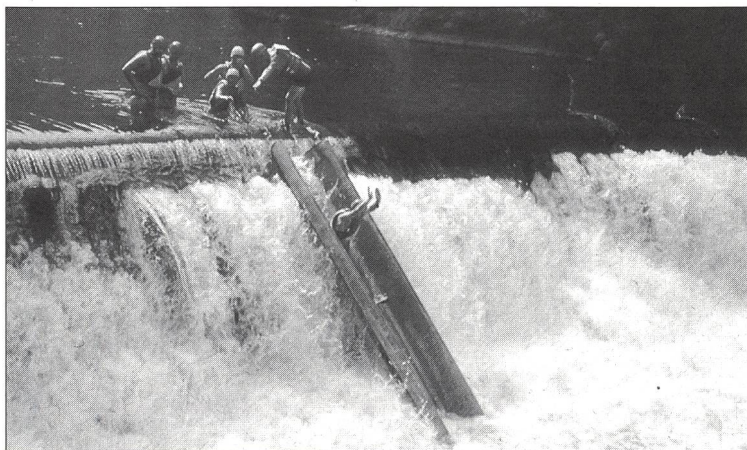
Lo spassoso passaggio sullo scivolo sul Doubs.