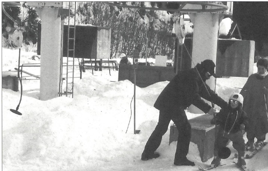
D'estate nei campi, d'inverno agli impianti di risalita.

per accogliere in modo ottimale i portatori di handicap. A partire dal prossimo anno avremo dunque a disposizione circa 200 posti letto.