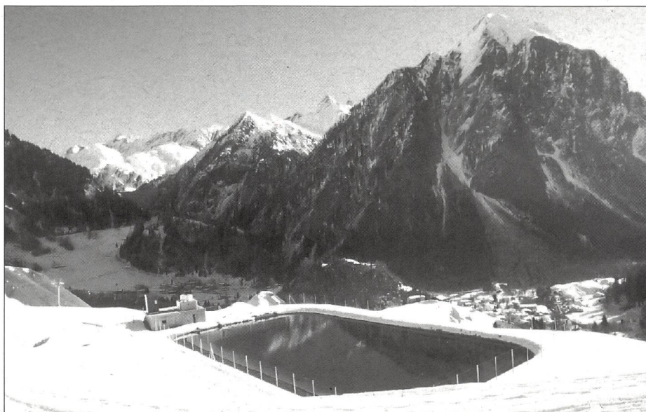
Un bacino artificiale per lo sci e l'agricoltura.

erano pochi e praticamente legati ad una stazione sciistica precisa. Anche G+S è cresciuto enormemente negli ultimi anni e la creazione del centro alla Torretta ha portato ad una nuova concezione della formazione: tutti i corsi hanno come campo base Bellinzona e giornalmente si effettuano degli spostamenti in direzione delle località invernali, se possibile del Ticino, altrimenti fuori Cantone. La nuova concezione, oltre a collaborare con tutte le stazioni in egual modo senza privilegiarne nessuna, evita tutti i problemi di pianificazione, effimera per la mancanza di neve, in uno o nell'altro posto. Inoltre questa