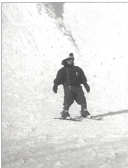
O vera o artificiale ...

La stazione sciistica di Campo Blenio, una delle prime nate in Ticino, è il frutto di una moltitudine di collaborazioni e della volontà e dell'impegno di tutti gli abitanti di Campo e della regione. L'importanza economica, molti agricoltori e giovani della zona trovano nell'attività degli impianti un'occupazione secondaria, ma anche affettiva che ha fatto accettare con entusiasmo i nuovi ed ingenti investimenti per lavori di miglioramento e l'installazione dei cannoni da neve per la produzione programmata della neve.