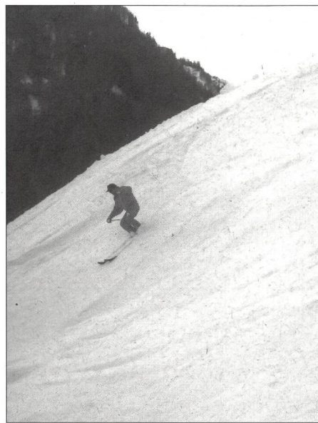
... l'importante è sciare.

so l'apertura di tutti gli impianti di risalita di Campo Blenio e dunque di dare l'occasione agli sciatori di usufruire e sfruttare al meglio le possibilità di questa stazione. Nostra grande soddisfazione è vedere che la gente ha capito che la neve programmata non è nociva o dannosa ma è del tutto naturale ed uguale a quella tradizionale. La neve programmata è infatti prodotta con acqua e solo con temperature sufficientemente basse. La garanzia di trovare piste senza sassi od erba ha dunque invogliato molti a venire a Campo Blenio a sciare. Inoltre questa stazione offre le condizioni ideali per imparare a sciare o ad andare con lo snowboard. Molti sono i giovani per la prima volta alle prese con gli sci o i più grandi che si cimentano con la tavola. Le famiglie godono qui di facilitazioni e di sconti sul prezzo delle giornaliere perché uno degli obiettivi di Campo è proprio di permettere a tutti, anche ai meno abbienti, di praticare questo sport. La stazione di sci fa ormai parte della mentalità di tutti gli abitanti del paese e dell'alta Valle di Blenio ed il mantenimento ed il rinnovo delle sue strutture sono sempre accolti fa-