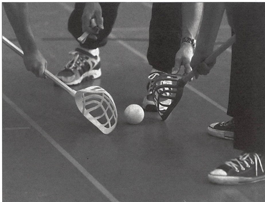
Rimessa in gioco: pallina fra i bastoni con cestino rovesciato.