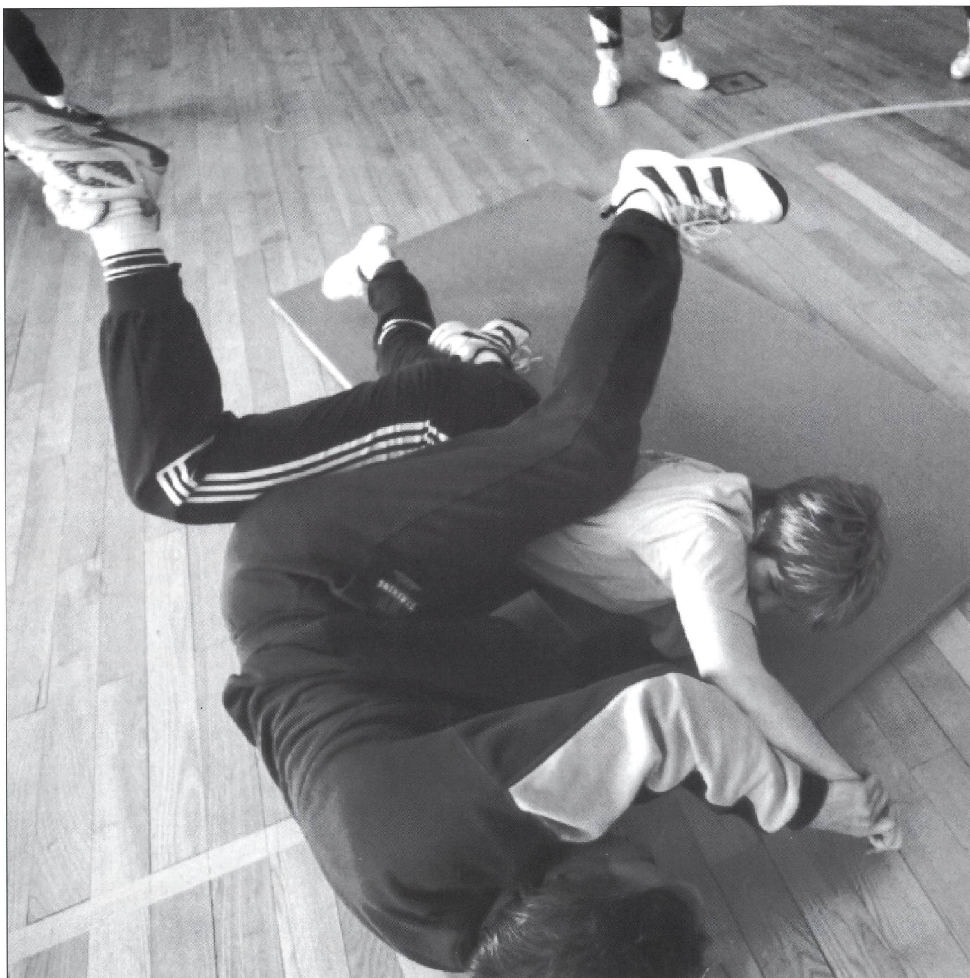
Anche le donne di Macolin si difendono ...